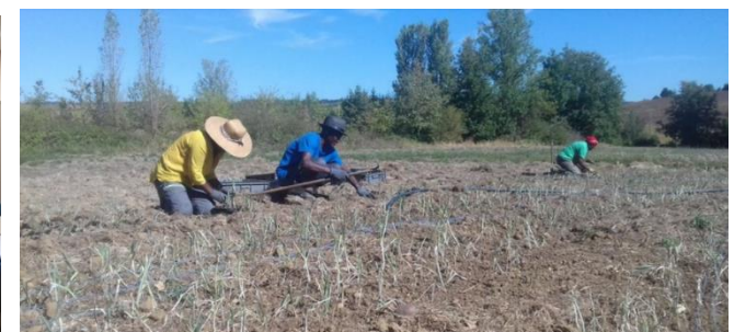
FA1 - Hydroferme