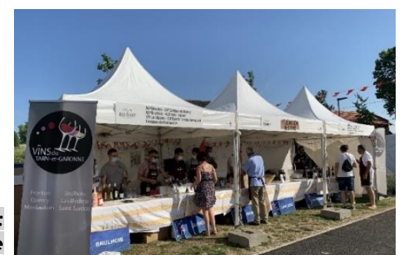
FA7 - Soirée événement : Projet coopératif œnotourisme