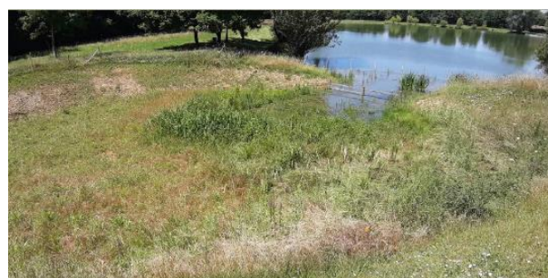
FA6 - Frayère