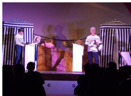
FA4 - Festival