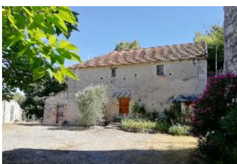
FA2 - Gîte touristique