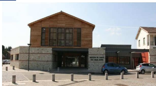
FA3 - Maison de santé