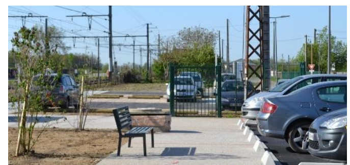
FA5 - Pôle d'échanges multimodal