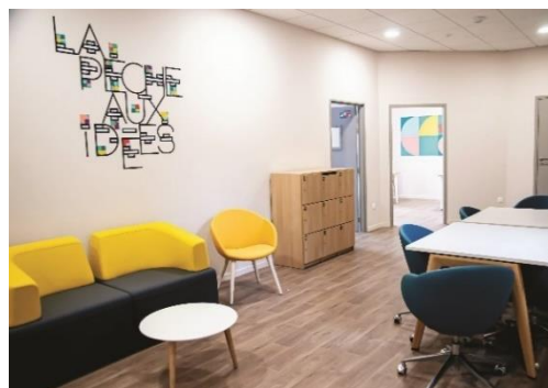
FA1 - Tiers lieu