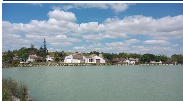
FA2 - Base de loisirs