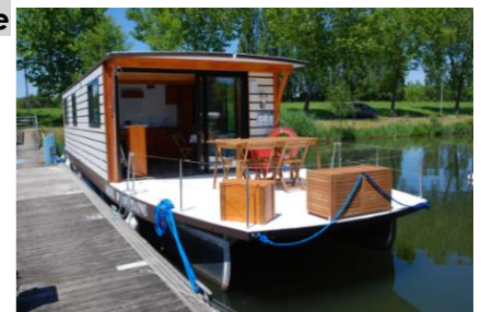
FA2 - Bateau solaire